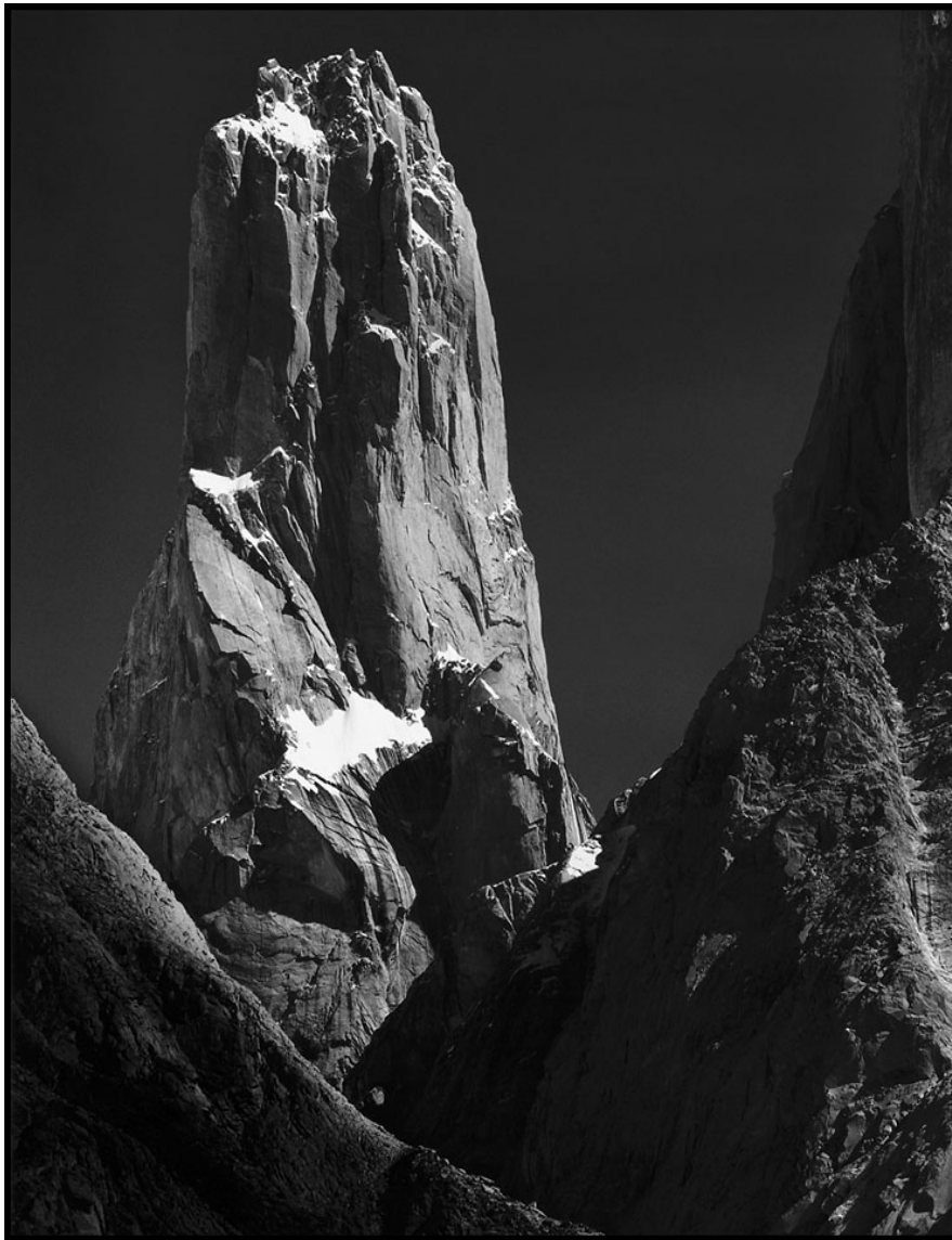
Nederlandse Trango Tower Expeditie 2010